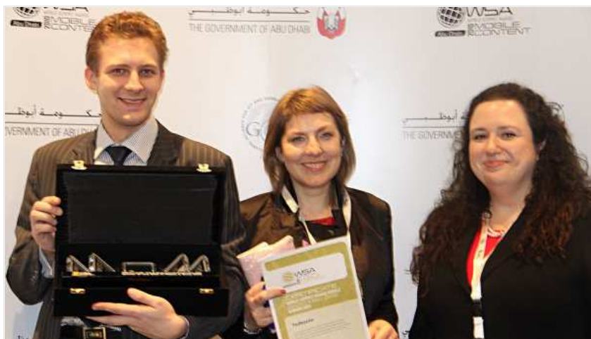
World Summit Award geht an RIA Novosti