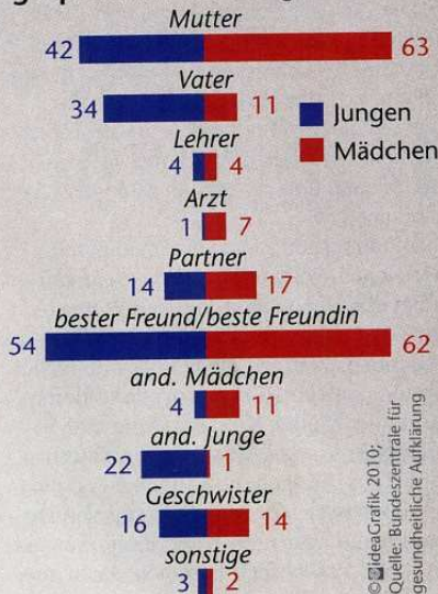
© ideaGrafik 2010; Quelle: Bundeszentrale für gesundheitliche Aufklärung

wertschätzende Begleitung und qualifizierte Hilfe. Dies setzt voraus, dass sich mögliche Täter, aber auch Opfer, wenn sie sich mit ihrem Leid anvertrauen, auf die Schweigepflicht seitens der Helfer verlassen können. Helfer müssen mit der sich daraus ergebenden ethischen und moralischen Spannung umgehen können.