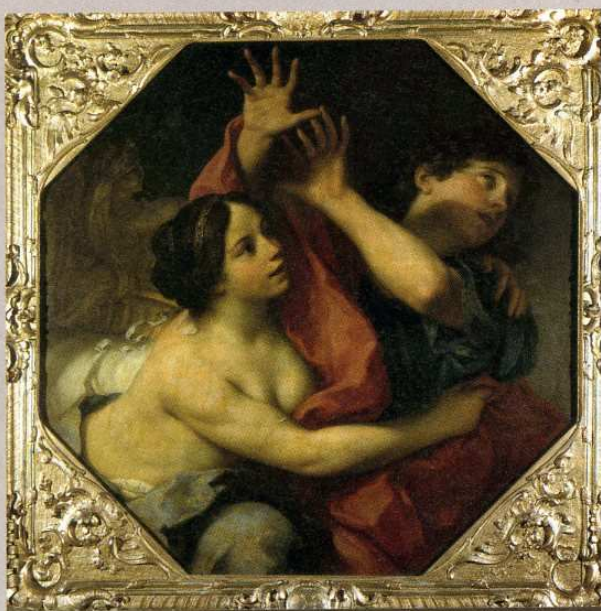
Die Macht der Sexualität ist auch in der Bibel kein Tabu. So versucht die Frau des Potiphars, Josef zu verführen (1. Mose 39. Das Gemälde zeigt, wie Carlo Cignani es sah, um 1678/80)